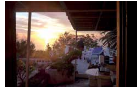
2021. Arbeitsecke im Abendlicht • Rincón de trabajo a la luz de la tarde