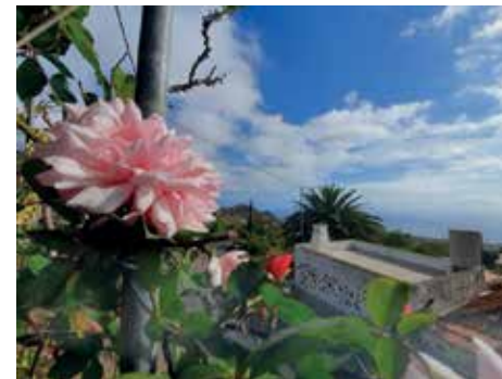
Blick vom Nachbarshaus über unser Dach aufs Meer. • Vista desde la casa vecina sobre nuestro techo hacia el mar.