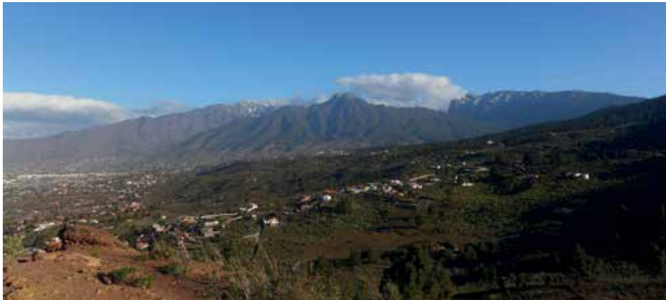
Blick auf unsere Gegend (Alcalá, El Frontón) beim Spaziergang auf der Montaña Rajada • vista de nuestra zona durante un paseo por la Montaña Rajada