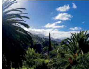
2018. Blick vom Haus nach Süden • vista al sur