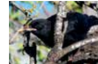
Junger Graja • joven graja