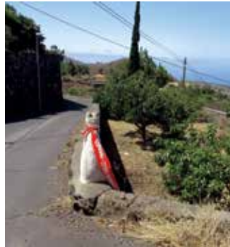
10.07.2021, nach einem Autorennen. Unsere Steinkatze saß ca. 30 Jahre am Hauseingang • después de una carrera de coches. Nuestro gato de piedra se sentó durante unos 30 años en la entrada de la casa.