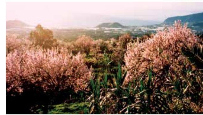
Blick durch den Garten ins Tal und Haus in den 80er-Jahren • vista a través del jardín hacia el valle y la casa en los años 80