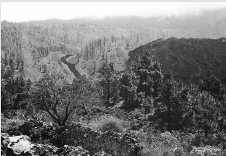
04.04.2022. Der kleine schnelle Strom kam am 01.10.2021 direkt zur Häusergruppe, floss später in den großen • La pequeña y rápida colada llegó directamente al grupo de casas el 01.10.2021, para luego desembocar en la gran colada.

imagen espectacular delante de la casa, ésta aparecía a menudo en vídeos y en la compilación al final de la erupción. Tan arriba, cerca de la primera boca, fluía rápidamente, transportando rocas enormes. Directamente junto a la casa había un pequeño monte en el cual se encontraba un pino que había crecido después del incendio del 2016 y que tenía una copa casi redonda. (A lo largo de los años hubo varios incendios que casi nos alcanzan; los vecinos más jóvenes, una vez incluido yo, mojaron las casas día y noche con mangueras de jardín. En la Cabeza de Vaca floreció con especial intensidad en la primavera posterior). En este cerro se encontraban camarógrafos con máscaras antigás. Al final solo se veía la antigua palmera grande, al menos su contorno, como si fuera un fantasma. Era impresionante que resistiera tanto.