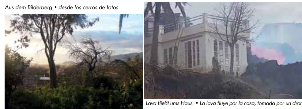
Lava fließt ums Haus. • La lava fluye por la casa, tomada por un dron.

* Algunos visitantes y sus libros ambientados en la isla: Regina Nössler (Premio Alemán para la mejor Novela Negra): “Wanderurlaub” (Thriller). Un grupo y el guía de senderismo se encuentran por primera vez en el hotel. La naturaleza muestra su lado peligroso. Pero el verdadero peligro no está en la naturaleza. Los excursionistas