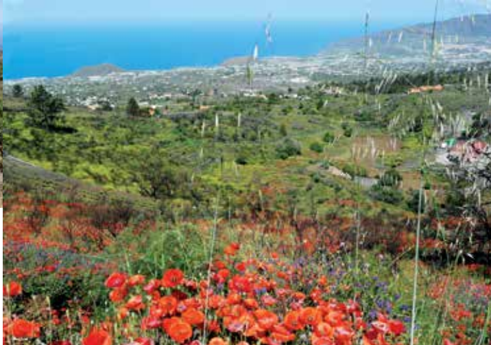
Blick ins Tal beim Spaziergang auf der Cabeza de Vaca • vista del valle desde Cabeza de Vaca