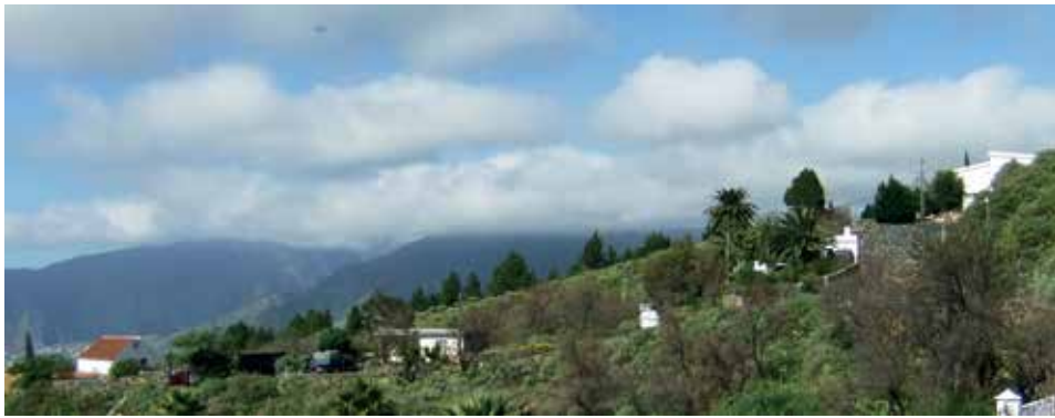
Das Haus, versteckt in den Palmen • la casa, escondido entre las palmeras