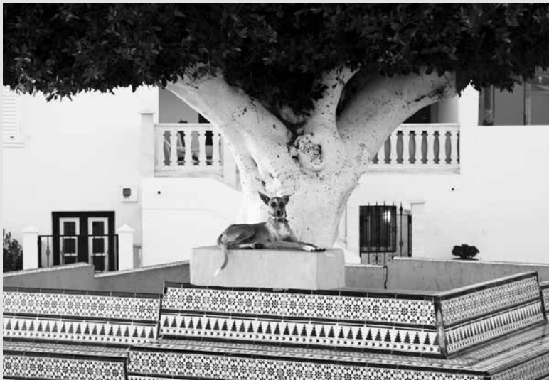
„Der gelbe Hund“ in Puerto Naos • "El perro amarillo".

Wenn es einmal zu einer Nachauflage kommen sollte, würde ich die Adressen und Namen des Verschwundenen zu den Fotos und Texten hinzuschreiben. Zum Beispiel stünde dann unter meinem Vorwort „Calle El Frontón 7“, unter dem Text „Der Hundeboulevard“ „Calle Alcalá“ und unter den Gedichten von Lucía Rosa González: „El Pampillo“ (Todoque).